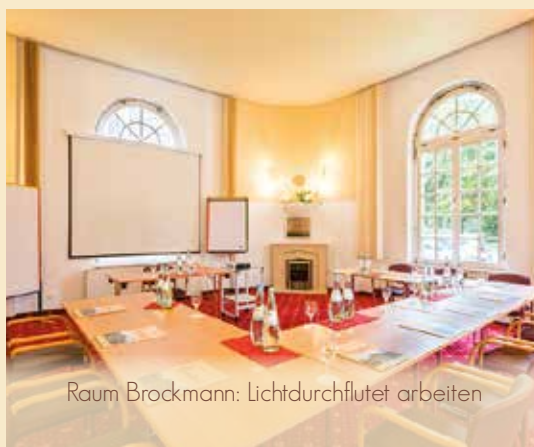
Raum Brockmann: Lichtdurchflutet arbeiten