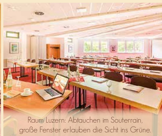
Raum Luzern: Abtauchen im Souterrain, große Fenster erlauben die Sicht ins Grüne.