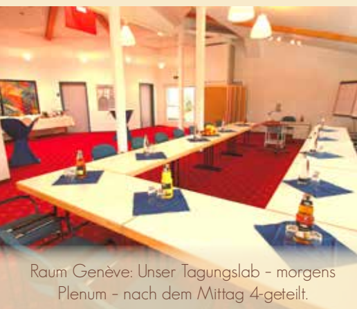
Raum Genève: Unser Tagungslab - morgens Plenum - nach dem Mittag 4-geteilt.