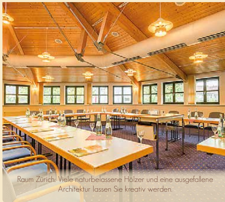
Raum Zürich: Viele naturbelassene Hölzer und eine ausgefallene Architektur lassen Sie kreativ werden.

Alle Tagungsräume sind mit W-LAN ausgestattet. Zahlreiche Gruppenräume und Nischen erlauben konzentriertes Arbeiten in ruhiger Atmosphäre! Die Räume Bern, St. Moritz und Lugano sind mit viel Tageslicht und dem „Blick ins Grüne“ für Gruppenarbeit ideal!